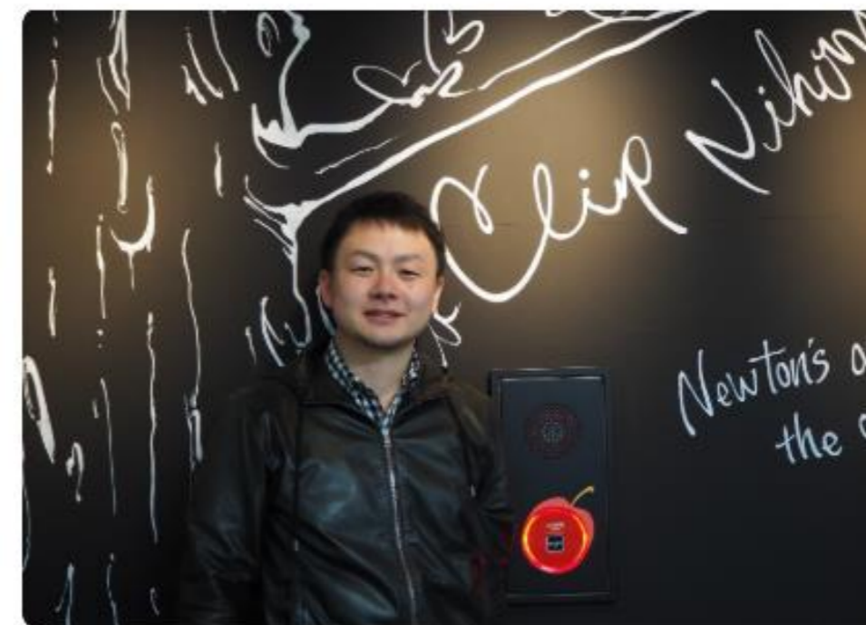
【Venture Capital】 Reality Accelerator様

https://kigyolog.com/interview.php?id=53