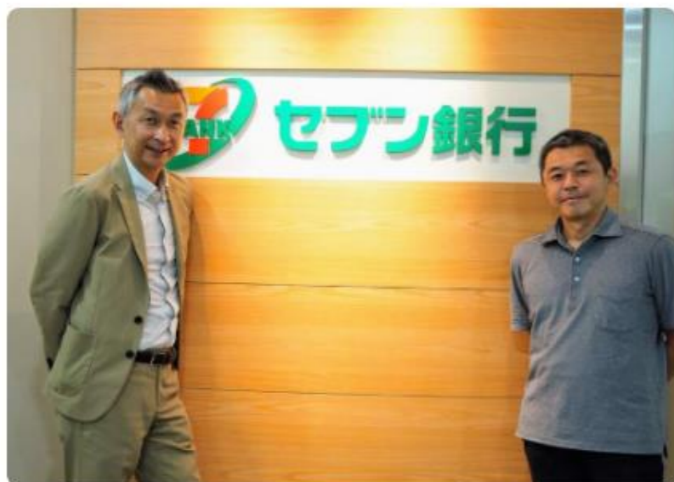
【事業会社】 セブン銀行様